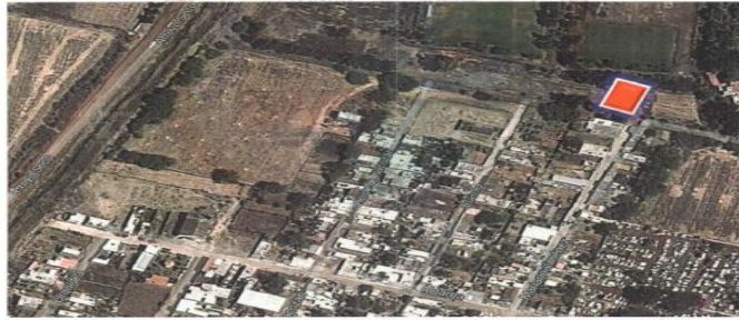
UBICACIÓN DENTRO DEL MUNICIPIO DE CHAVINDA MICHOACÁN.

EN ATENCIÓN A LA SOLICITUD DE AVALUO A ESTA DIRECCIÓN DE OBRAS PÚBLICAS, QUE SE REQUIERE DEL TERRENO UBICADO EN LA COLONIA SAN PEDRO Y SAN PABLO, EN LA PRIVADA NUEVO CAMPESTRE S/N.